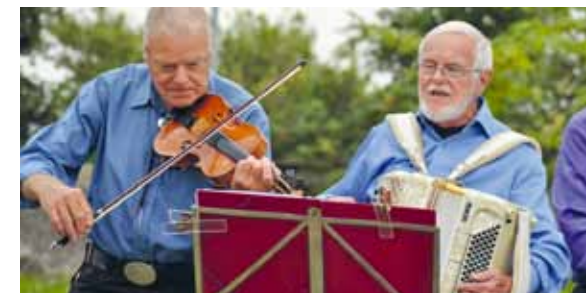
Internationella fyrdagen firas 3:e helgen i augusti.