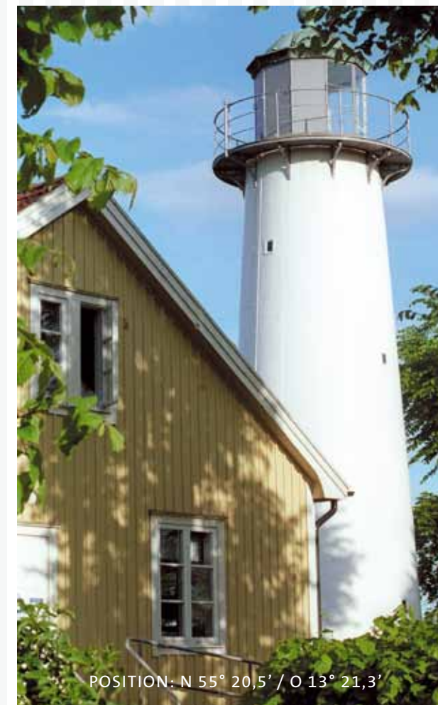
POSITION: N 55° 20,5' / O 13° 21,3'

Smygehuk FYR & LOGI STF VANDRARHEM | B&B