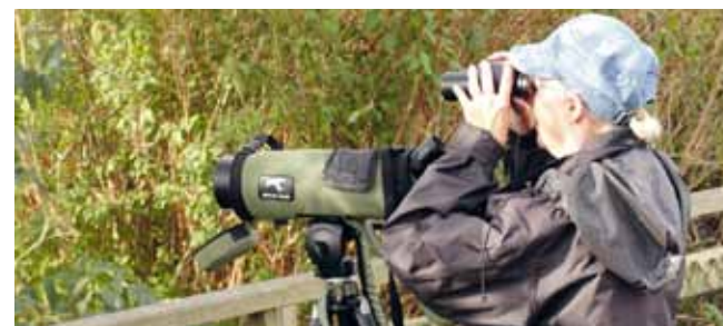
Smygehuk är ett bra utgångsläge för fågelskådaren. Se transträcken dra förbi.

En cykeltur är spännande! I Smyge med omnejd bröt man kalk fram till 1950-talet. Kalkugnar ute på slätten vittnar om den tiden. Hamnen var en gång ett kalkbrott och det gamla kalkberget ligger i dagen när det är lågvatten, miljoner år gammalt.