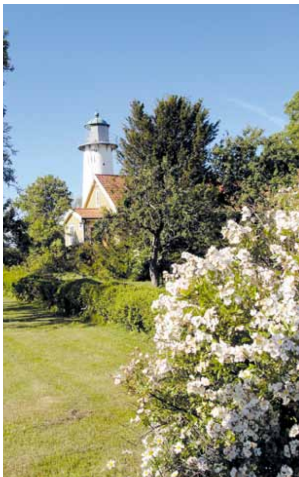
Trädgården inbjuder till lekar och spel – eller så sitter man på sjösidan och låter blicken vila långt ut över havet.