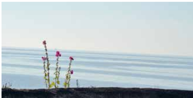
Här möts himmel och hav. Laxöringen är fin på vårvintern,

Söderslättis småvägar med dess byar, kyrkor och vida sädesfält är spännande att upptäcka från cykelsadeln. Hyr en cykel och utforska omgivningarna. Fiska, fågelskåda eller klättra upp i fyren och låt blicken vila mot horisonten! Varmt välkommen till ett hus med atmosfär – bli fyrvaktare för en natt!